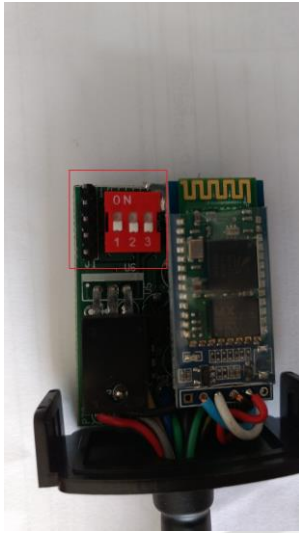
Todas entradas positivas

Para alterar o tipo de entrada além do comando também será necessário ajustar a posição da chave dip switch no interior do equipamento segue exemplo :